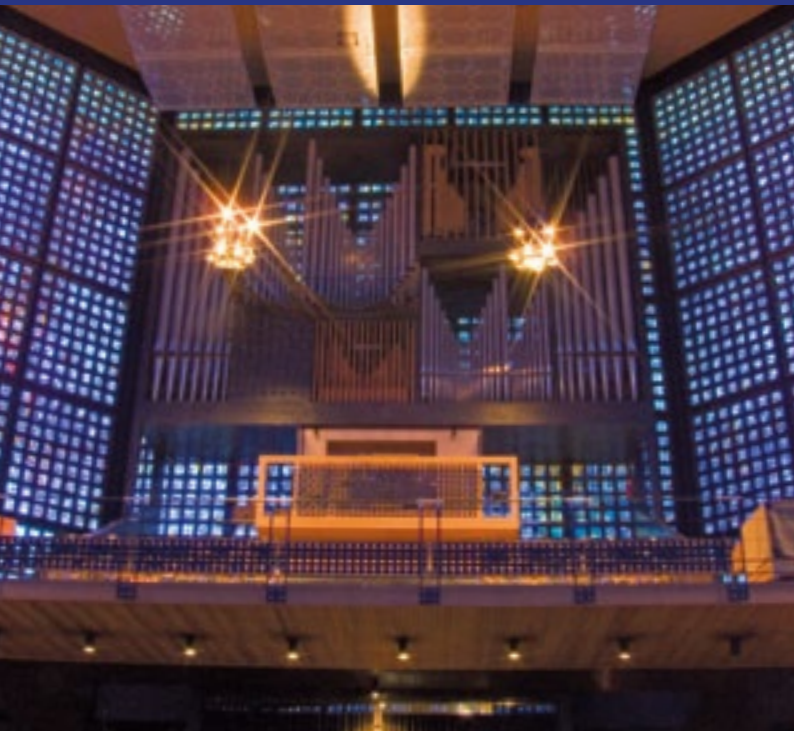
Die große Orgel der Kaiser-Wilhelm-Gedächtnis-Kirche, Karl Schuke Berliner Orgelbauwerkstatt