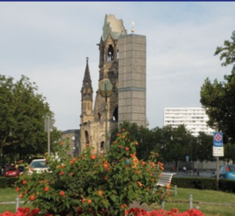
Die Kaiser-Wilhelm-Gedächtnis-Kirche von der Taentzienstraße (Europa-Center) aus gesehen im September 2009

→ Bis zur Wiedereinweihung des Berliner Domes 1993 hatte der Staats- und Domchor jahrzehntelang seine Hauptwirkungsstätte am Breitscheidplatz; er wird darum im Jubiläums-Gottesdienst singen (18.12.).