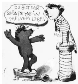
Große Auswahl an Janosch Farbradierungen

Berlins größter Fachhandel für Rahmen und Kunstdrucke