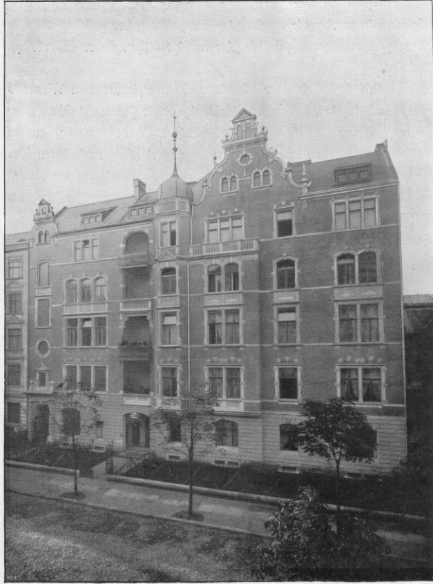
Strassenansicht. Architekten Reimarus & Hetzel.