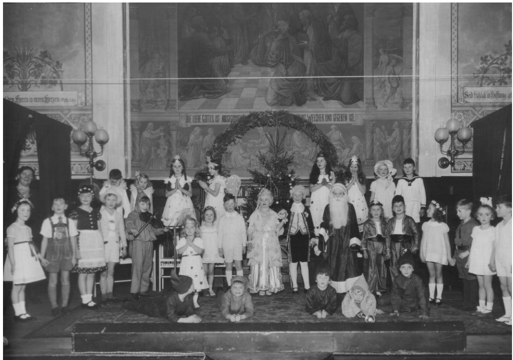
Weihnachtsfeier der Privatschule Hamann im Dezember 1933 im Gemeindesaal

15.02.1927 „Frl. Hamann wird die Benutzung eines Konfirmandensaales zu Schulzwecken zugewilligt gegen Erstattung einer Nutzungsgebühr.“